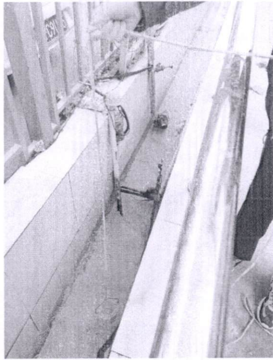
图 2-4 厂区排口采样照片