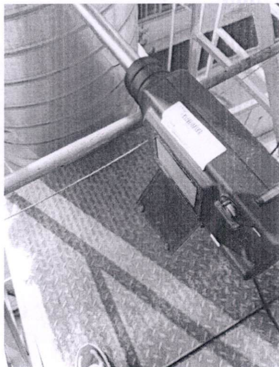
图 2-1 喷塑车间出口现场采样照片