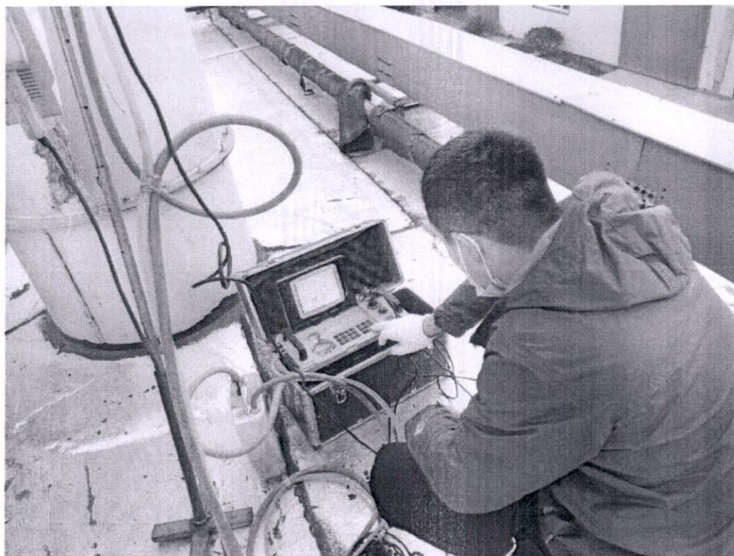
图 2-3 热解炉燃烧废气现场采样照片